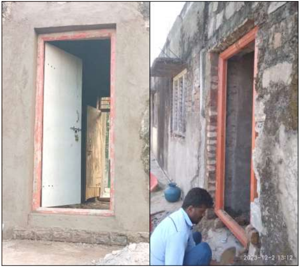
ಸಮಸ್ಯೆಗೆ ಇತ್ತೀಚೆಗೆ ಹಾದು ಹೋಗಿದೆ ಎಂದು ಕ್ಷೇತ್ರ ಶಿಕ್ಷಣಾಧಿಕಾರಿ

ತೇರದಾಳ : ಇಲ್ಲಿಯ ಅಂಬೇಡ್ಕರ್ ನಗರ ಸರಕಾರಿ ಕಿರಿಯ ಪ್ರಾಥಮಿಕ ಶಾಲೆಗೆ ತೆರಳಲು ಮಕ್ಕಳಿಗೆ ಉಂಟಾಗಿದ್ದ ರಸ್ತೆ ಸಮಸ್ಯೆ ಇಂದು ಸಾರ್ವಜನಿಕರ ಸಹಕಾರದೊಂದಿಗೆ ಬಗೆಹರಿಯುವುದರ ಮೂಲಕ ಅನುಕೂಲವಾಗಿದೆಯೆಂದು ಶಿಕ್ಷಣ ಇಲಾಖೆ ಅಧಿಕಾರಿಗಳು ತಿಳಿಸಿದ್ದಾರೆ. ಈ ಶಾಲೆಯ ಹಿಂದುಗಡೆ ರಸ್ತೆ ನಿರ್ಮಿಸಿ, ಹೊಸ ಬಾಗಿಲು ಜೋಡಿಸಿ ವಿದ್ಯಾರ್ಥಿಗಳ ಸಂಚಾರಕ್ಕೆ ಅನುಕೂಲ ಮಾಡಲಾಗಿದೆ. ಕಳೆದ ಹಲವು ವರ್ಷಗಳಿಂದ ಉಂಟಾಗಿದ್ದ ರಸ್ತೆ