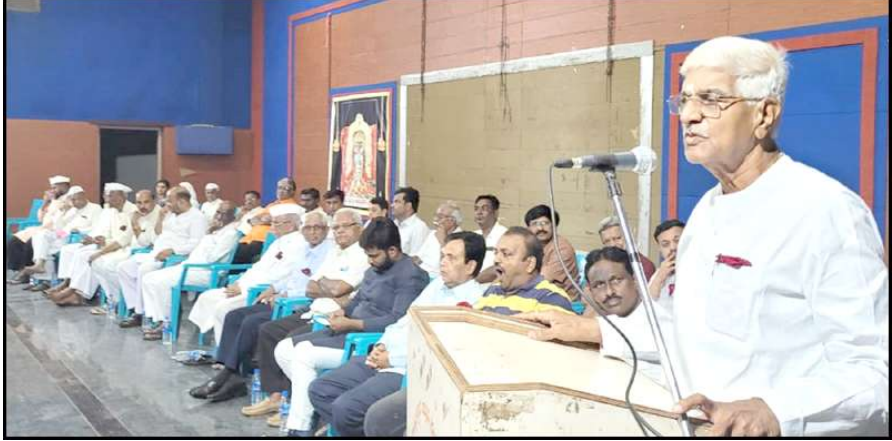
ಇದು ಖಂಡನೀಯವಾಗಿದೆ. ಬ್ಯಾಂಕ್ ಅಭಿವೃದ್ಧಿಯಾಗಬೇಕು ಎಂಬುದು ನಮ್ಮ ಗುಂಪಿನ ಮುಖ್ಯ ಉದ್ದೇಶವಾಗಿದೆ. ಯುವಕರಿಗೂ ಕೂಡಾ ಸಮಾನ ಅವಕಾಶಗಳನ್ನು ನೀಡಬೇಕು ಎಂದು ತಿಳಿಸಿದರು.