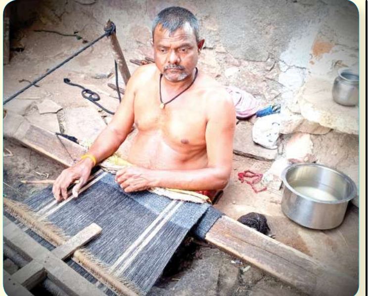
'ಕಂಬಳಿ ನೇಯ್ಗೆಯಿಂದ ಉತ್ತಮ ಲಾಭವೆನೂ ಇಲ್ಲ. ಹಿರಿಯರ ಪರಂಪರೆ ಉಳಿಸಬೇಕೆಂಬುದಾಗಿದೆ. ಅದೂ ಸಾಧ್ಯವಾಗುತ್ತಿಲ್ಲ. ಸರ್ಕಾರ ಗಮನಹರಿಸಿದ್ದಲ್ಲಿ ಈ ಕಸಬು ಮುಂದುವರೆಯಲು ಸಾಧ್ಯ.'