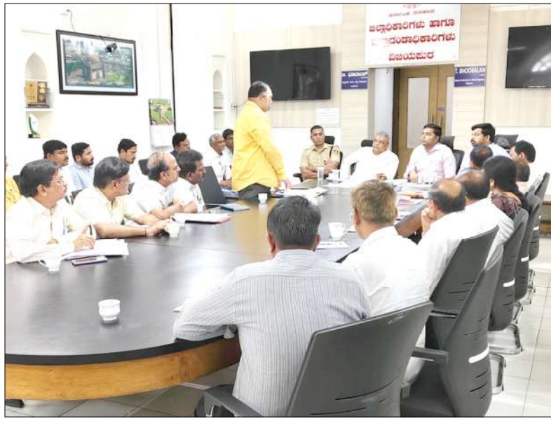
ಕರ್ತವ್ಯ ನಿರ್ವಹಿಸುತ್ತಿರುವ ಸಿಬ್ಬಂದಿಗಳನ್ನು ಕುಡಿಯುವ ನೀರಿನ ಸಭೆ: ನಿರೋಧಿಸುವಂತೆ ಸಭೆಯಲ್ಲಿ ತಿಳಿಸಿದರು. ಜಿಲ್ಲೆಯಲ್ಲಿ ಅತೀ ನೀರಿನ ತೊಂದರೆ- ಜಿಲ್ಲಾಧಿಕಾರಿ ಟಿ.ಭೂಬಾಲನ್ ಮಾತನಾಡಿ.

ವತಿಯಿಂದ ಸರ್ಕಾರಕ್ಕೆ ವರದಿಯನ್ನು ಕಳುಹಿಸಿ ತಕ್ಷಣ ಕ್ರಮ ವಹಿಸುವಂತೆ ಜಿಲ್ಲಾಡಳಿತ ಹಾಗೂ ನಾವುಗಳು ಕೂಡಿ 50 ಲಕ್ಷ ರೂಗಳ ಅನುದಾನ ಬಿಡುಗಡೆಗೆ ಕ್ರಮ ವಹಿಸೋಣ ಎಂದು. ಏಪ್ರಿಲ್ ಹಾಗೂ ಮೇ ಮಾಹೆಗಳಲ್ಲಿ ಬಿಸಿಲಿನ ತಾಪ ಹೆಚ್ಚಾಗುವುದು ಕಾರಣ ಈಗಿನಿಂದಲೇ ರೈತರ ಸಹಾಯಕ್ಕೆ ಮುಂದಾಗಬೇಕು. ರೈತರು ಬೆಳೆದ ಲಿಂಬೆ ಬೆಳೆಗಳನ್ನು ಹೇಗಾದರೂ ಮಾಡಿ ಉಳಿಸಿಕೊಳ್ಳೋಣ ಒಮ್ಮೆ ಗಿಡ ಒಣಗಿದರೆ ಮತ್ತೆ ಲಿಂಬೆ ಬೆಳೆಯಬೇಕಾದರೆ ಸುಮಾರು 5ರಿಂದ 6 ವರ್ಷಗಳ ಕಾಲ ಕಾಯಬೇಕು. ಲಿಂಬೆ ಬೆಳೆಗೆ ಭಾಗದ ರೈತರ ಜೀವನಾಡಿಯಾಗಿದೆ. ಈ ಭಾಗದ ಲಿಂಬೆಗೆ ವಿಶೇಷ ಗುಣಮಟ್ಟದ ಹೊಂದಿದ್ದು ಲಿಂಬೆ ಬೆಳೆಗಾರರಿಗೆ ಒಳ್ಳೆಯ ಮಾರುಕಟ್ಟೆ ಸೌಲಭ್ಯ ಉತ್ತಮ ದರವನ್ನು ಒದಗಿಸಲು ಕ್ರಮ ವಹಿಸಬೇಕು. ಇಂಡಿ ಕಚೇರಿಯಲ್ಲಿ ಸಿಬ್ಬಂದಿಗಳ ಕೊರತೆ ಇದ್ದು ಆದಷ್ಟು ಬೇಗ ಬೇರೆ ಬೇರೆ ಇಲಾಖೆಗಳಲ್ಲಿ