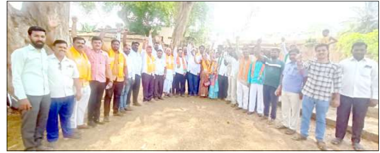
400 ಕ್ಕೂ ಹೆಚ್ಚು ಸ್ಥಾನಗಳಲ್ಲಿ ಗೆಲುವು ತಲುಪಲಿದೆ. ಪ್ರಧಾನಿ ಮೋದಿ ಕೈಗೊಂಡ ಸಾಧಿಸಲಿದ್ದಾರೆ ಎಂದರು. ಪ್ರಮುಖ ನಿರೀಕ್ಷೆಗಳಿಂದ ದೇಶದಲ್ಲಿ ಕಳೆದ ವರ್ಷದ ಅವಧಿಯಲ್ಲಿ ಪ್ರಧಾನಿ ಮೋದಿ ಅವರು ಅಧಿಕ ನೀತಿ ಕಾರಾಡುವ ಮೂಲಕ ವಿಶ್ವದಲ್ಲಿ 5ನೇ ಸ್ಥಾನದಲ್ಲಿತ್ತು ಮುಂದಿನ ಕೆಲವು ವರ್ಷಗಳಲ್ಲಿ 3ನೇ