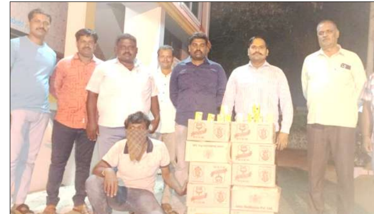
ಬಾಗಲಕೋಟೆ : ಲೋಕಸಭಾ ಸಾರ್ವತ್ರಿಕ ಚುನಾವಣೆ ಹಿನ್ನೆಲೆಯಲ್ಲಿ ಅಕ್ರಮವಾಗಿ ಮನೆಯಲ್ಲಿ ಸಂಗ್ರಹಿಸಿದ್ದ 69.120 ಲೀಟರ್ ಮದ್ಯವನ್ನು ಅಬಕಾರಿ ಇಲಾಖೆ ದಾಳಿ ನಡೆಸಿ ವಶಕ್ಕೆ ಪಡೆದುಕೊಂಡಿದೆ. ದಾಳಿ ನಡೆಸಿ ವಶಕ್ಕೆ ಪಡೆದುಕೊಂಡಿದೆ. ಮುಧೋಳ ವಲಯ ವ್ಯಾಪ್ತಿಯ ಬೆಳಗಲ ಸರ್ಕಾರಿ ರಸ್ತೆ ಗಾವಲು ಸಮಯದಲ್ಲಿ ಬಂದ ಖಚಿತ ಮಾಹಿತಿ ಮೇರೆಗೆ ಮನೆಯೊಂದರ ಮೇಲೆ ದಾಳಿ ನಡೆಸಿದಾಗ ದಿಕ್ಕಿ ಮತ್ತು ಒರಟಿನಲ್ ಚಾಯ್ಸ್

ಬಾಗಲಕೋಟೆ : ಪ್ರಸಕ್ತ ಲೋಕಸಭಾ ಸಾರ್ವತ್ರಿಕ ಚುನಾವಣೆಗೆ ಲೋಕಸಭಾ ಪ್ರಾರಂಭವಾದ ದಿನಾಂಕದಿಂದ ಇಲ್ಲಿಯವರೆಗೆ ಒಟ್ಟು 631 ಅಬಕಾರಿ ಪ್ರಕರಣಗಳನ್ನು ದಾಖಲಿಸುವ ಮೂಲಕ 671 ಜನ ಆರೋಪಿಗಳನ್ನು ಬಂಧಿಸಿ ನಿಯಮಾನುಸಾರ ಕ್ರಮ ಜರುಗಿಸಲಾಗಿದೆ ಎಂದು ಅಬಕಾರಿ ಉಪ ಆಯುಕ್ತರು ಪ್ರಕಟಣೆಯಲ್ಲಿ ತಿಳಿಸಿದ್ದಾರೆ.