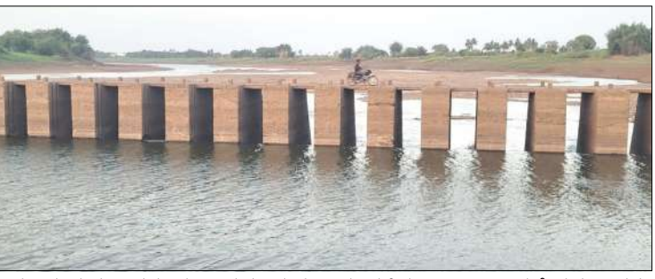
ಬರುತ್ತಿರುವುದರಿಂದ ರಬಕವಿ ಬನಹಟ್ಟಿ ಮತ್ತು ಮುತ್ತಲಿನ ಗ್ರಾಮೀಣ ಪ್ರದೇಶದ ಜನರ ನಿಟ್ಟುಸಿರು ಬಿಟ್ಟಂತಾಗಿದೆ. ಅವಳಿ ನದಿಗಳಲ್ಲಿ ನದಿ ನೀರನ್ನು ನಾಳದ ಮೂಲಕ ಸರಬರಾಜು ರೀತಿಯಾಗಿ ರಬಕವಿ ಬನಹಟ್ಟಿ ಹಾಗೂ ಸುತ್ತ ಕಾರ್ಯ ನಡೆದಿದೆ. ನೀರನ್ನು ಕಾಯ್ದು ಆರಿಸಿ

ರಬಕವಿ-ಬನಹಟ್ಟಿ:ಹದಿನೈದು ದಿನಗಳಿಗಿಂತ ಹೆಚ್ಚು ಕಾಲ ಸಂಪೂರ್ಣವಾಗಿ ಬತ್ತಿ ಹೋಗಿದ್ದ ಕೃಷ್ಣಾ ನದಿಗೆ ನೀರು ಹರಿದು ಬರುತ್ತಿದೆ. ಮಹಾರಾಷ್ಟ್ರದ ಕೊಯ್ನಾ ಜಲಾಶಯದಿಂದ ಕರ್ನಾಟಕ ಮತ್ತು ಮಹಾರಾಷ್ಟ್ರದ ಗಡಿ ಪ್ರದೇಶದ ರಾಜಾಪುರ ಬ್ಯಾರೇಜ್ ಮೂಲಕ ನೀರು ಹರಿಸಿತ್ತು. ಬುಧವಾರ ಸಂಜೆ ರಬಕವಿಯ ಸಮೀಪದ ಮಹಿಷವಾಡಗಿ ಬ್ಯಾರೇಜ್ ಗೆ ಸಾಕಷ್ಟು ಪ್ರಮಾಣದಲ್ಲಿ ನೀರು ಹರಿದು ಬಂದಿದ್ದು, ಗುರುವಾರ ಕೃಷ್ಣಾ ನದಿಯ ನೀರು ಹಿಪ್ಪರಗಿ ಜಲಾಶಯವನ್ನು ಕೂಡಾ ತಲುಪಿದೆ. ಕೃಷ್ಣಾ ನದಿಗೆ ನೀರು ಹರಿದು