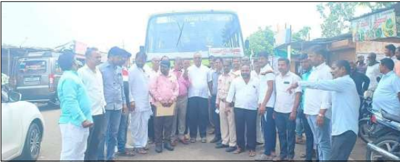
ನಿಲುಗಡೆಯ ಆದೇಶ ಮಾಡಿರುವ ಕುರಿತು ಜಾಲಕ ನಿರ್ವಹಕರಿಗೆ ಸೂಚಿಸಿದರು. ಈ ಸಂದರ್ಭದಲ್ಲಿ ಎರಡು ಗ್ರಾಮಗಳ ಹಲವಾರು ಮುಖಂಡರು ಹಾಗೂ ಗ್ರಾಮದ ಯುವಕರು ಉಪಸ್ಥಿತರಿದ್ದರು.