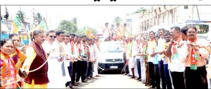
ಭಾಂಡಗಿ, ರಾಜ್ಯದಲ್ಲಿರುವ ಕಾಂಗ್ರೆಸ್ ಸರ್ಕಾರ ಬಡವರೊಂದಿಗೆ, ಜನವಿರೋಧಿ ಸರ್ಕಾರವಾಗಿದೆ. ಮೊನ್ನೆ ನಡೆದ ಲೋಕಸಭಾ ಚುನಾವಣೆಯಲ್ಲಿ ರಾಜ್ಯದಲ್ಲಿ ಸರ್ಕಾರ ಇದ್ದರೂ ಕೂಡಾ 140 ಕಾಂಗ್ರೆಸ್ ಶಾಸಕರ ಕ್ಷೇತ್ರದಲ್ಲಿ ಕಾಂಗ್ರೆಸ್ ಸೋತಿದೆ. ಬಾಗಲಕೋಟೆ ಜಿಲ್ಲೆಯ 7 ಮತಕ್ಷೇತ್ರದಲ್ಲಿ ಕಾಂಗ್ರೆಸ್ ಸೋತಿದೆ.

ಬಾಗಲಕೋಟೆ : ರಾಜ್ಯಕ್ಕೆ ಜನವಿರೋಧಿ ಕಾಂಗ್ರೆಸ್ ಎಂಬ ದಂದ್ರ ಹಾಗೂ ಶನಿ ಸರ್ಕಾರ ಗಂಟು ಬಿದ್ದಿದ್ದು ಸದ್ಯ ಸರ್ಕಾರದ ಪತನ ಪ್ರಾರಂಭವಾಗಿದ್ದು ಬಹಳದಿನ ಈ ಸರ್ಕಾರ ಅಡಳಿತದಲ್ಲಿ ಇರೋದಿಲ್ಲಾ ಎಂದು ರಾಜ್ಯಸಭಾ ಸದಸ್ಯ ನಾರಾಯಣಸಾ ಭಾಂಡಗಿ ಹೇಳಿದರು. ಅವರು ನಗರ ಬಸವೇಶ್ವರ ವೃತ್ತದಲ್ಲಿ ಭಾರತೀಯ ಜನತಾ ಪಾರ್ಟಿ ಜಿಲ್ಲಾ ಘಟಕ ದಿಂದ ರಾಜ್ಯ ಸರ್ಕಾರದ ಬೆಲೆ ಏರಿಕೆ ವಿರುದ್ಧ ಹಮ್ಮಿಕೊಂಡ ಪ್ರತಿಭಟನೆಯನ್ನು ದ್ದೇಶಿಸಿ ಮಾತನಾಡಿದರು.