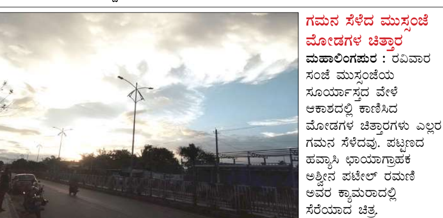
ಗಮನ ಸೆಳೆದ ಮುಸ್ಸಂಚಿ ಮೋಡಗಳ ಚಿತ್ರಾರ ಮಹಾಲಿಂಗಪುರ : ರವಿವಾರ ಸಂಜೆ ಮುಸ್ಸಂಚಿಯ ಸೂರ್ಯಾಸ್ತದ ವೇಳೆ ಆಕಾಶದಲ್ಲಿ ಕಾಣಿಸಿದ ಮೋಡಗಳ ಚಿತ್ರಾರಗಳು ಎಲ್ಲರ ಗಮನ ಸೆಳೆದವು.