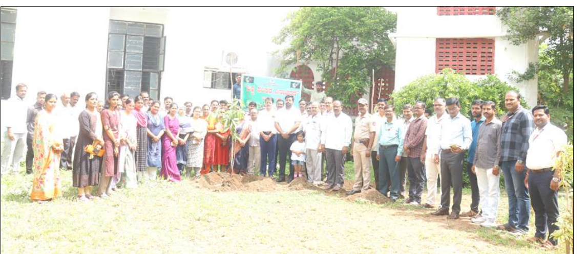
ವಿಧಾನವನ್ನು ನಾವು ಅಳವಡಿಸಿಕೊಂಡು ಸಾರ್ವಜನಿಕರಲ್ಲಿಯೂ ಜಾಗೃತಿ ಮೂಡಿಸಬೇಕು ಎಂದು.