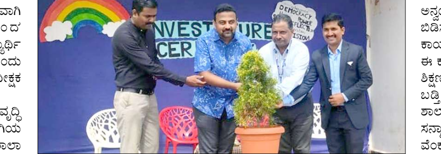
ಮಾದರಿಯಾಗಿಟ್ಟುಕೊಂಡು, ಅದೇ ಮಾದರಿಯಲ್ಲಿ ನಮ್ಮ ಶಾಲಾ ಸಂಸ್ಥೆಗೆ ಚುನಾವಣೆ ನಡೆಯಿತು. ಶಾಲಾ ಸಂಸ್ಥೆಗೆ ಬಹುದೊಡ್ಡ ಪ್ರಜ್ಞಾಪೂರ್ವಕವಾದವನ್ನು ಉದ್ಘಾಟಿಸಿ ಮಾತನಾಡಿದರು.