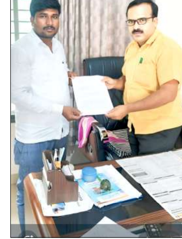
ಬೀದಿಗೆ ಬೀಳುತ್ತಿವೆ. ಕೌಟುಂಬಿಕ ಹಾಗೂ ಸಾಮಾಜಿಕ ಕಲಹಗಳು ಹೆಚ್ಚಾಗಿ ಗ್ರಾಮಗಳಲ್ಲಿ