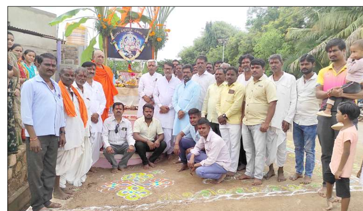
ಮಾತನಾಡಿ, ಬದುಕಿನಲ್ಲಿ ಕರ್ತವ್ಯವೇ ಶ್ರೇಷ್ಠ ಎಂದು ಸಾರಿದವರು ವಿಶ್ವಕರ್ಮ ಮಹಾಗುರುಗಳು. ಆದ್ದರಿಂದ ವಿಶ್ವಕರ್ಮ ಸಮಾಜ ಬಾಂಧವರು ದುಶ್ಚಟಗಳಿಂದ ಹೊರ ಬಂದು ಮಕ್ಕಳಿಗೆ ಯೋಗ್ಯ ಶಿಕ್ಷಣ ಕೊಡಿಸಬೇಕು. ಸರಕಾರದ ಸಹಾಯ ಸೌಲಭ್ಯ ಪಡೆದುಕೊಂಡು ಅಧಿಕರಣವಾಗಿ