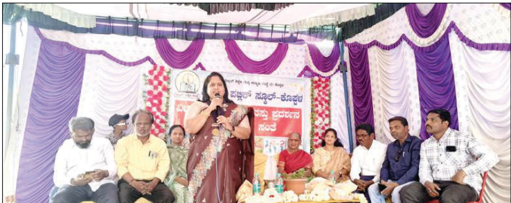
ವಸ್ತುಗಳ ಖರೀದಿ ಇತರ ವಿಷಯದ ಬಗ್ಗೆ ಮಕ್ಕಳಿಗೆ ತಿಳುವಳಿಕೆ ಮೂಡಿಸಿ ಬರಲು ಸಂತ ಮೇಳ ಅತ್ಯಂತ ಸಹಕಾರಿಯಾಗಿದೆ ವಿಜ್ಞಾನ ಮತ್ತು ಗಣಿತ ವಸ್ತು ಪ್ರದರ್ಶನ ವಿವರಿಸಿ ಮಕ್ಕಳಲ್ಲಿ ಜಾಗೃತಿ ಮೂಡಿಸುತ್ತದೆ ಇಂತಹ ಒಳ್ಳೆ ಕಾರ್ಯಕ್ರಮಗಳನ್ನು ಇಲ್ಲಿನ ಮಿಲ್ ಶಾಲೆಯವರು ಏರ್ಪಡಿಸುವುದು ಒಳ್ಳೆಯ ಕಾರ್ಯವಾಗಿದೆ ಎಂದರು.