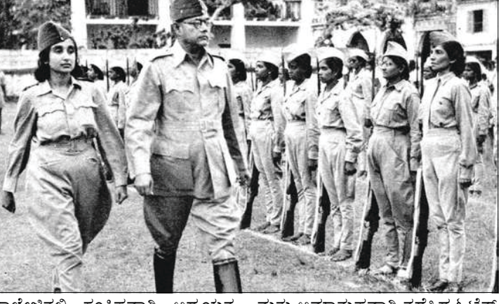
ಕಾಲೇಜಿನಲ್ಲಿ ಸಂಕ್ಷಿಪ್ತವಾಗಿ ಅಧ್ಯಯನ ಮಾಡಿದರು. ಅವರ ಭಾರತೀಯ ವಿರೋಧಿ ದೃಷ್ಟಿಕೋನಗಳು ಮತ್ತು ಭಾರತೀಯ ವಿದ್ಯಾರ್ಥಿಗಳನ್ನು ಅಮಾನುಷವಾಗಿ ನಡೆಸಿಕೊಂಡ ಪ್ರಾಧ್ಯಾಪಕರ ಮೇಲೆ ಹಲ್ಲೆ ನಡೆಸಿದ್ದಕ್ಕಾಗಿ ಅವರನ್ನು ಹೊರಹಾಕಲಾಯಿತು. ನಂತರ ಅವರು ಕಲ್ಕತ್ತಾಗೆ ಹೋಗಿ ಕಲ್ಕತ್ತಾ ವಿಶ್ವವಿದ್ಯಾಲಯದ ಅಡಿಯಲ್ಲಿ ಸ್ವಾಭಿಮಾನ ಚರ್ಚಾ ಕಾಲೇಜಿಗೆ ಸೇರಿದರು ಮತ್ತು 1918 ರಲ್ಲಿ ತತ್ತ್ವಶಾಸ್ತ್ರದಲ್ಲಿ ಪದವಿ ಪಡೆದರು.

ಭಾರತೀಯ ಸ್ವಾತಂತ್ರ್ಯಕ್ಕಾಗಿ ಅನೇಕ ಮಹನೀಯರು ಅನೇಕ ರೀತಿಯಲ್ಲಿ ಹೋರಾಟ ನಡೆಸಿ ಭಾರತಕ್ಕೆ ಸ್ವತಂತ್ರ ಒದಗಿಸಿ ಕೊಟ್ಟರು. ಭಗತ್ ಸಿಂಗ್, ಚಂದ್ರಶೇಖರ್ ಆಜಾದ್, ಮಹಾತ್ಮ ಗಾಂಧಿ, ಜವಾಹರ್ ಲಾಲ್ ನೆಹರು, ಸುಭಾಷ್ ಚಂದ್ರ ಬೋಸ್, ಲಾಲಾ ಲಜಪತ್ ರಾಯ್, ಬಾಲ ಗಂಗಾಧರ ತಿಲಕ್ ಮುಂತಾದವರು ಭಾರತದ ಸ್ವಾತಂತ್ರ್ಯ ಹೋರಾಟದಲ್ಲಿ ಸಕ್ರಿಯ ಪಾತ್ರವನ್ನು ವಹಿಸಿದ್ದರು. ಅವರಲ್ಲಿ ಸುಭಾಷ್ ಚಂದ್ರ ಬೋಸ್ ಅವರು ಮಹಾನ್ ಭಾರತೀಯ ಸ್ವಾತಂತ್ರ್ಯ ಹೋರಾಟಗಾರರಾಗಿದ್ದರು. ಅವರು ಭಾರತೀಯ ಸ್ವಾತಂತ್ರ್ಯ ಹೋರಾಟಕ್ಕೆ ಜಾಗತಿಕ ವೇದಿಕೆಯನ್ನು ಒದಗಿಸುವಲ್ಲಿ ಮತ್ತು ವಿಶ್ವ ಶಕ್ತಿಗಳ ಬೆಂಬಲವನ್ನು ಸಂಗ್ರಹಿಸುವಲ್ಲಿ ಅವರ ಕೊಡುಗೆಯನ್ನು ಎಂದಿಗೂ ಮರೆಯಲಾಗದು. ಅವರು ಭಾರತೀಯ ಸ್ವಾತಂತ್ರ್ಯ ಹೋರಾಟಕ್ಕೆ ಬೆಂಬಲವನ್ನು ಸಂಗ್ರಹಿಸಲು ಅನೇಕ ವರ್ಷಗಳ ಕಾಲ ವಿಶ್ವದಾದ್ಯಂತ ಪ್ರವಾಸ ಮಾಡಿದರು.