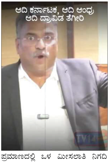
ಆದಿ ಕರ್ನಾಟಕ, ಆದಿ ಆಂಧ್ರ ಆದಿ ದ್ರಾವಿಡ ತೀರಣಿ

ಸಿಹಿ ಕಹಿ ಸುದ್ದಿ. ಕುಪ್ಪೆಗಿ : ಈ ಬಲಗೈ ಪಂಗಡದವರು ಮಾದಿಗರನ್ನು ಕಾನೂನಿನ ಸುಳಿಯಲ್ಲಿ ಸಿಲುಕಿಸುವ ಪ್ರಯತ್ನ ಷಡ್ಯಂತ್ರ ರೂಪಿಸುತ್ತಿದ್ದಾರೆ. ಆದಿ ದ್ರಾವಿಡ, ಆದಿ ಕರ್ನಾಟಕ, ಆದಿ ಆಂಧ್ರ, ಎಂಬ ಪದಗಳ ಅಡಿಯಲ್ಲಿ ಹೊಲೆಯ/ಹೊಲೆಯರು, ಭಲವಾಡಿ, ಹಾಗೂ ಮಾದಿಗ/ಮಾದಿಗರ ಜಾತಿಗಳವರು ಇರುತ್ತಾರೆ. ಆದರೆ ಹೊಲೆಯ ಭಲವಾಡಿ ಜನಾಂಗದವರು ಅತಿ ಹೆಚ್ಚು ಜನಸಂಖ್ಯೆ ಹೊಂದಿರುವ ಸುಮಾರು 30 ಲಕ್ಷ ಚಲವಾಡಿ/ಹೊಲೆಯರು ಜನರು ಆದಿ ಕರ್ನಾಟಕ ಆದಿ ಆಂಧ್ರ ಆದಿ ದ್ರಾವಿಡ ಎಂಬ ಹೆಸರಿನಲ್ಲಿ ಜಾತಿ ಪ್ರಮಾಣ ಪತ್ರ ಪಡೆದಿದ್ದಾರೆ ಆದ್ದರಿಂದ ಹೊಲೆಯ/ಚಲವಾಡಿ ಜನಾಂಗ ದವರಿಗೆ ಅತಿ ಹೆಚ್ಚು