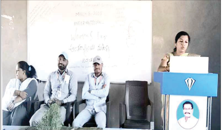
ಹೆಚ್ಚುತ್ತಿದ್ದು ಮಹಿಳೆಯರು ಎಲ್ಲ ಕ್ಷೇತ್ರಗಳಲ್ಲಿ ತೊಡಗಿಕೊಳ್ಳುವುದು ಅವಶ್ಯವಿದೆ. ರಾಜಕೀಯ, ಸಾಮಾಜಿಕ ಮತ್ತು ಸಾಂಸ್ಕೃತಿಕ ಚಟುವಟಿಕೆಗಳಲ್ಲಿ ಸಕ್ರಿಯವಾಗಿ ತೊಡಗಿಸಿಕೊಂಡು ತಾನು